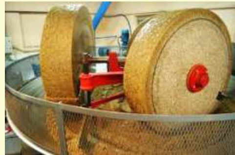
Macina a pietra moderna