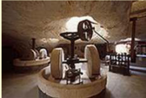
Macina a pietra antica